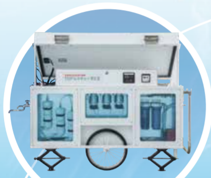
室内設置 イメージ