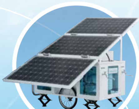
ソーラーパネル 展開イメージ